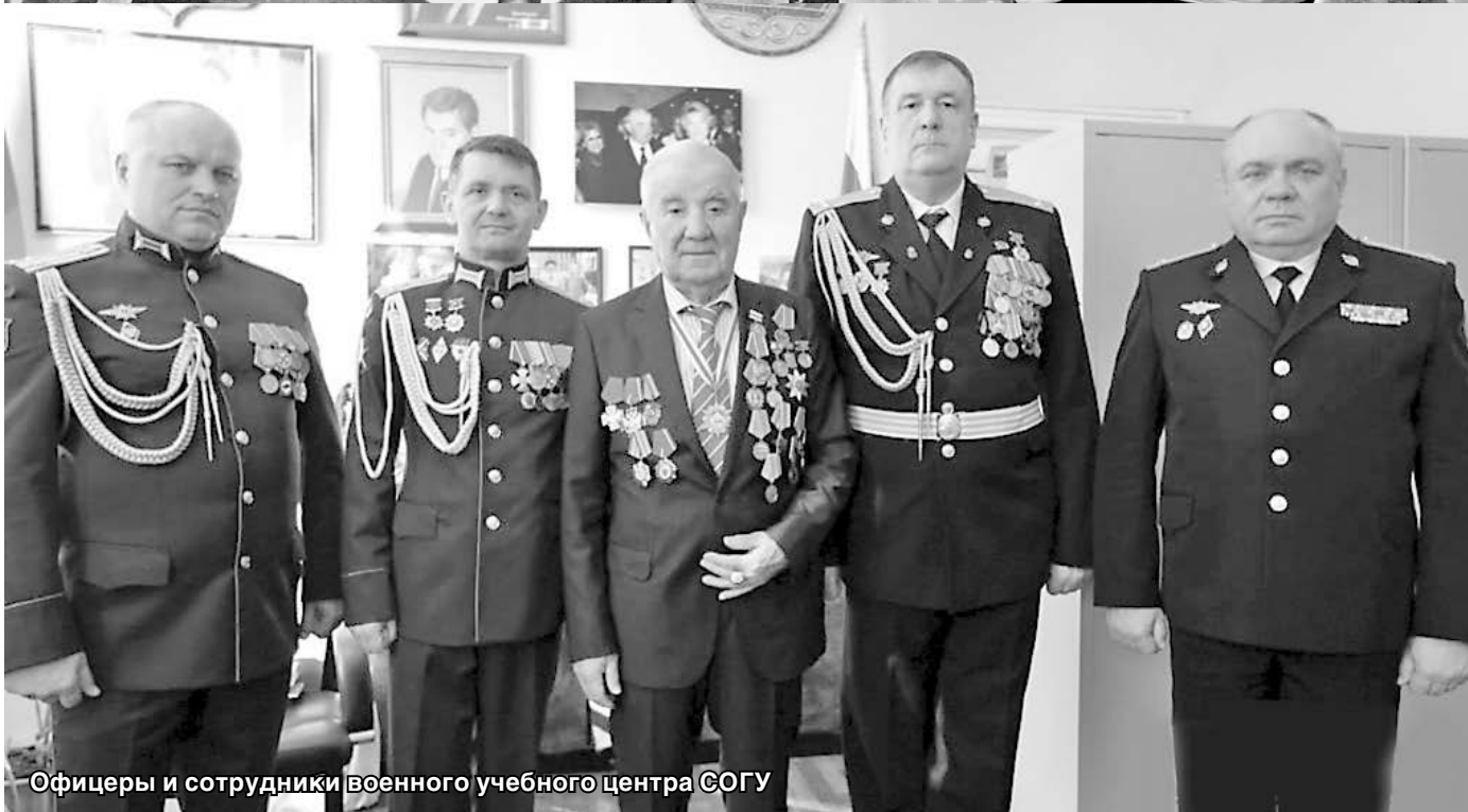
Офицеры и сотрудники Военного учебного центра СОГУ

После окончания института он работал в республиканских газетах и на радио. Профессия журналиста, очевидно, дала ему многое. И главное – интерес к человеку через призму его отношения к своему делу, к обществу. Журналист-писатель, который в нем жил, не растворился в высокой должности ректора, требовавшей полного погружения в решение больших и малых задач вуза.